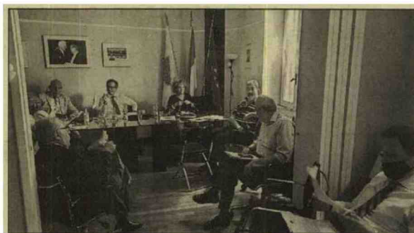
Il consiglio nazionale Inrl svoltosi ieri a Roma